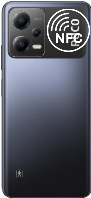
X5, X5 Pro