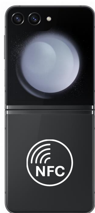
Galaxy Z Flip3

Zgodny z google: Większość Przetestowany: Tak