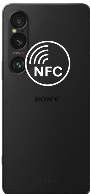
XPERIA 1 VI