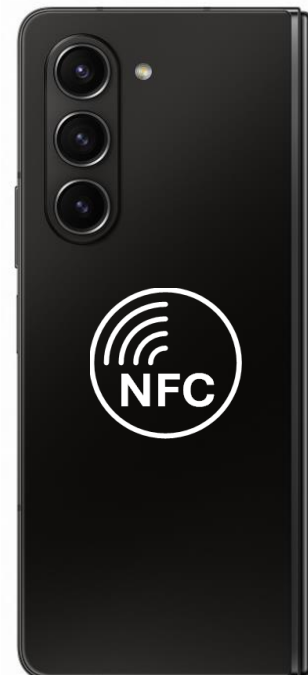
Galaxy Z Fold5