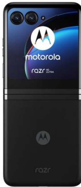
Razr 40 Ultra