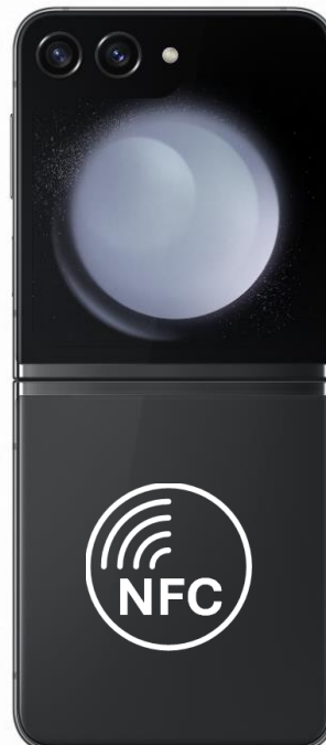
Galaxy Z Flip5