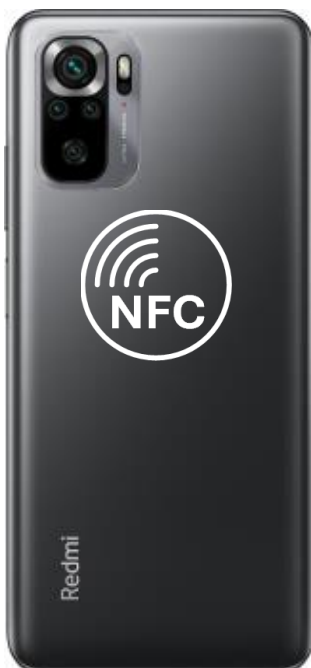
Redmi Note 10