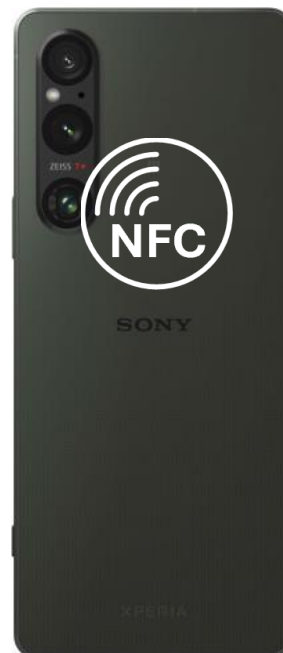
XPERIA 1 V