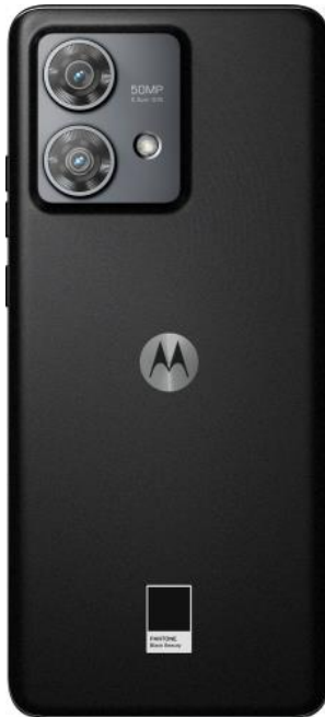
Edge 40 Neo