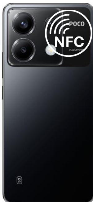
X6, X6 Pro