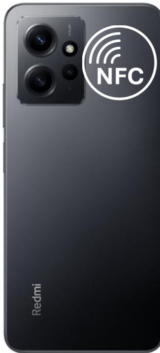
Redmi Note 12, 12 Pro

Zgodny z google: Większość Przetestowany: Tak