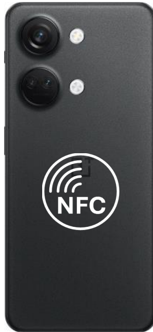
OnePlus Nord 3