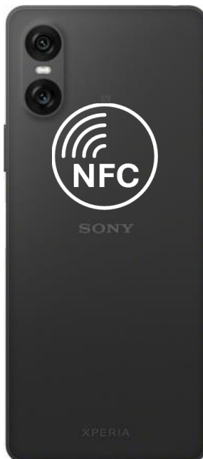
XPERIA 10 VI