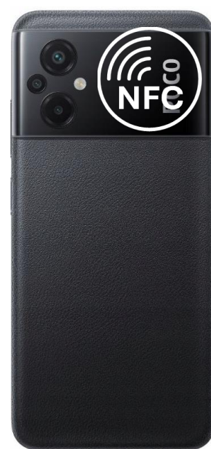
M5, M5 Pro