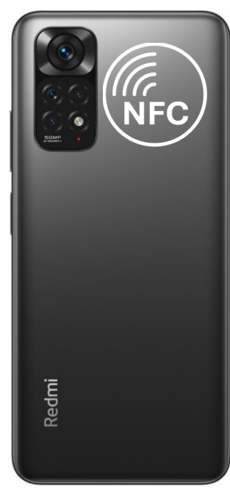
Redmi Note 11, 11 Pro

Zgodny z google: Większość Przetestowany: Tak