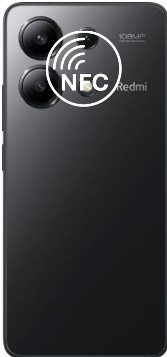
Redmi Note 13, 13 Pro

Zgodny z google: Większość Przetestowany: Tak